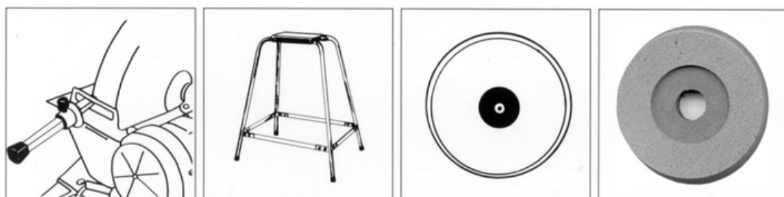
Avrivare för slipstenen